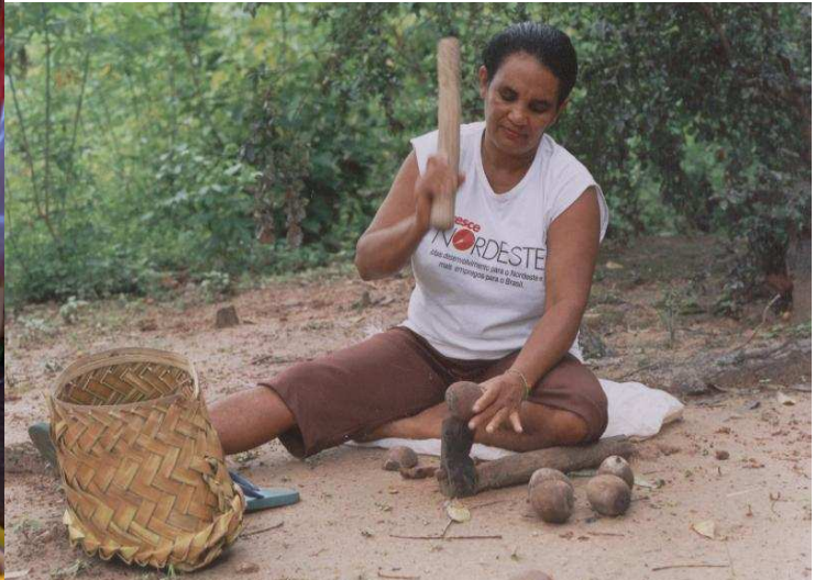
Exemplos de extrativismo com pequi ( Caryocar spp. ) e babaçu ( Orbignya phalerata ).