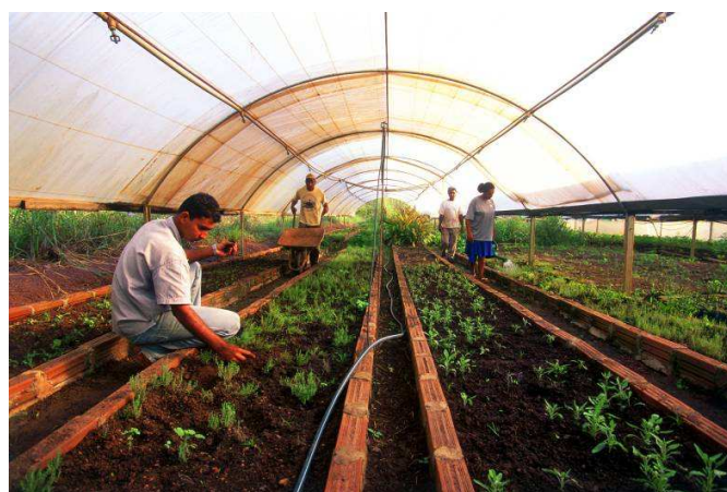
Cultivo de plantas medicinais