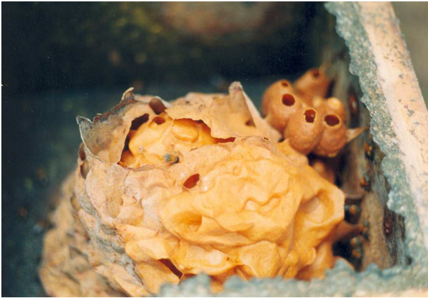
Meliponicultura (criação de abelhas nativas)